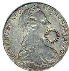
Etiopia di fine XIX Sc.

Tra il 1751 e il 2000 sono stati conia- ti circa 389 milioni di pezzi. Dal 1946, la zecca di Vienna ne ha emessi più di 49 milioni e viene tuttora prodotta.