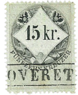
Fig. 4 - Marca da bollo da 15 kr., emissione del 1859, annullata con il timbro in cartella proprio della stazione ferroviaria.

no riuscito a recuperare in questi anni sono solo un frammento ed una marca sciolta recanti il timbro ferroviario in cartella che propone dimensioni di 47 x 7 mm. (fig 3, 4).