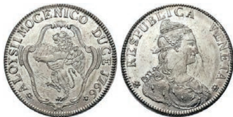
1° tipo, Doge Aloisi Mocenigo 1766