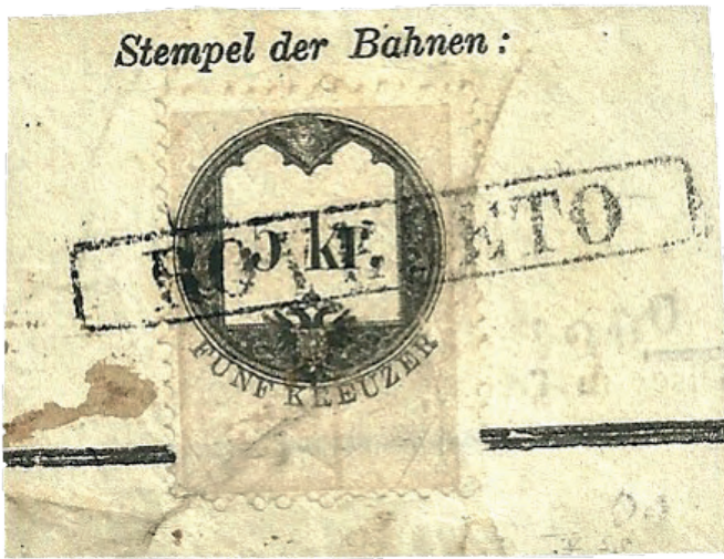
Fig. 3 - Frammento recante una marca da bollo per accompagnamento pacchi, emissione del 1861, annullata con il timbro in cartella proprio della stazione ferroviaria.