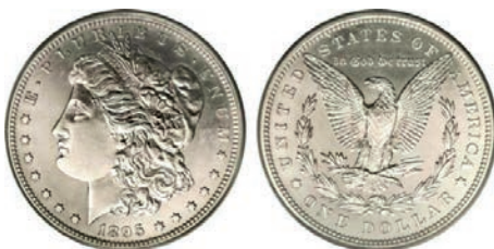
Argento 835/1000 - Ø 40 mm. – peso gr.27,08