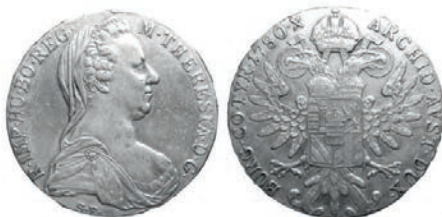
Argento 835/1000 - Ø 40 mm. – peso gr.27,08