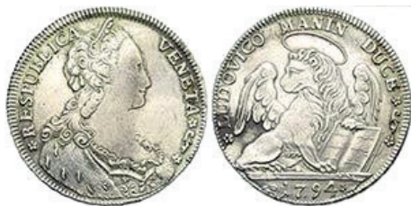
2° tipo, Doge Ludovico Manin 1794

Entrambe le monete, avevano lo stesso diametro e peso; Ø mm. 41 - gr. 28,61 - Titolo 835/1000