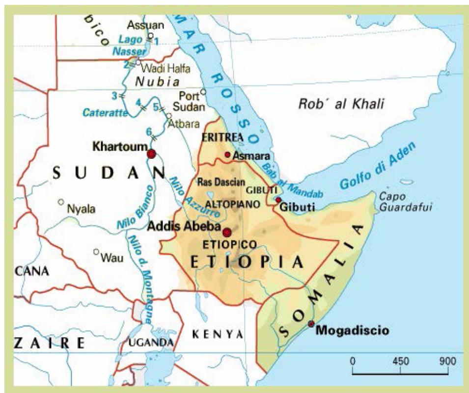
Cartina del Corno d'Africa "il Levante"

to economico e commerciale del proprio paese, dette vita al " Tallero " che prese presto il suo nome; questa nuova moneta, favorita dal ruolo di protettore dei beni dei cattolici in Oriente, che assunse l'impero d'Asburgo, si radicò presto e saldamente lungo tutti i paesi che si affacciavano sul Mar Rosso e sul Golfo di Aden (Il Levante). Questa moneta era destinata a una incredibile carriera mondiale.