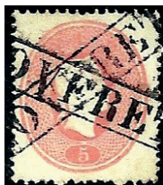
Fig. 1 - 5 soldi, emissione 1861, Regno Lombardo Veneto, annullato con duplice impronta del timbro in cartella, senza data, "ROVERETO", di origine ferroviaria.

Ebbi modo di acquistare quel francobollo vent'anni dopo con l'intermediazione dell'amico Agostino Zanetti e, a distanza di tanto tempo, confermo che, a tutt'oggi, quell'impronta è la sola che si conosca su un francobollo ordinario. (fig. 1)