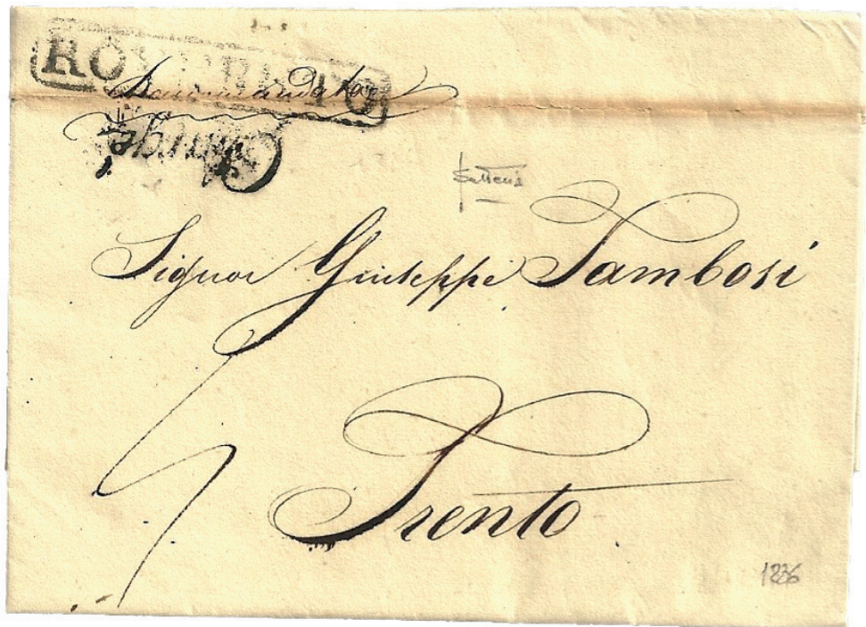
Fig. 2 - Lettera da Rovereto 16, agosto 1836, per Trento, recante il timbro in cartella "ROVERETO" in abbinamento al timbro di raccomandazione "Charge" risalente all'occupazione bavarese.

to ad un marcato deterioramento tant'è che, dopo il 1839, non ho più avuto occasione di rilevarne la presenza su lettera o altri documenti. (fig. 2)